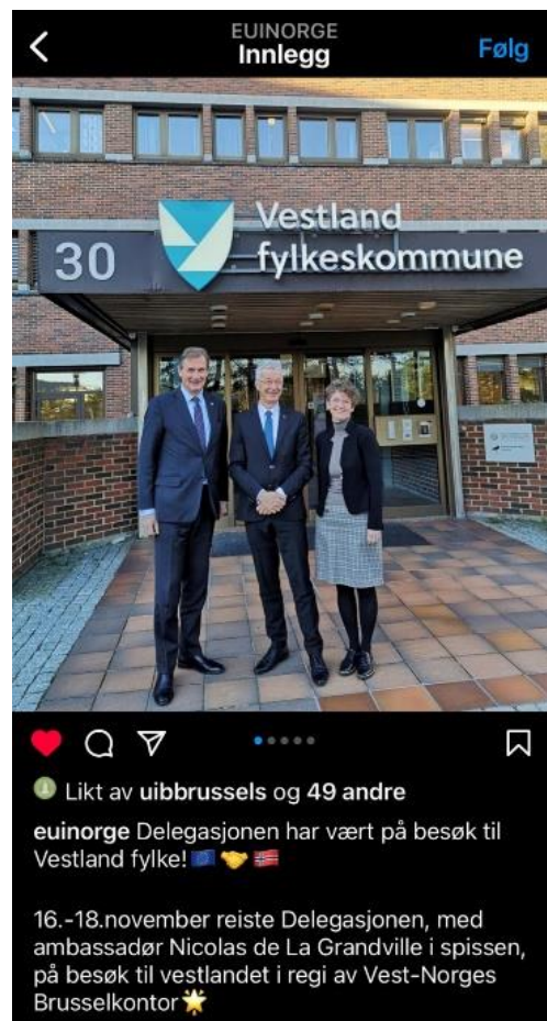
© Skjermdumper fra Delegasjonens kontoer på Facebook, Instagram og Twitter..