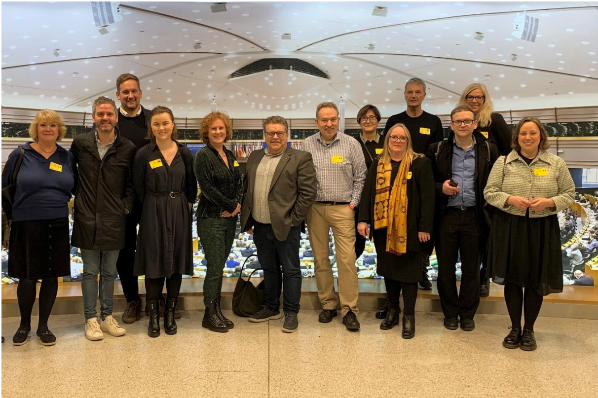
Forretningsutvalget i EU-parlamentet.

Kontoret lagde også studieprogrammet til Forretningsutvalget i Bergen kommune, som var på besøk i Brussel i november. Gruppen fikk et innblikk i sentrale EU-satsinger med relevans for vår region, og hvordan vi kan være med å bidra. På programmet stod også europeisk storby samarbeid, energipolitikk og besøk i Europaparlamentet.