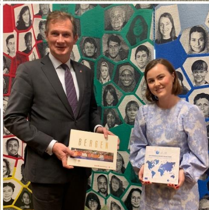
Ambassadøren sammen med representanter fra HVL, Vestland fylkeskommune, Bergen kommune, Øygarden kommune og Energiparken.