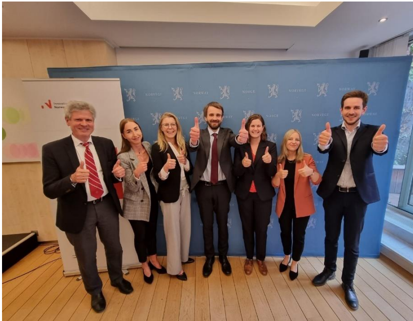
Næringsminister Jan Christian Vestre sammen med representanter fra noen av regionkontorene.

forumet for å få best mulig nytteverdi, samt presentasjon av kontorenes prioriteringer og hvordan man bruker ulike Brussel-nettverk. Rådgiverforumet hadde sitt første tematiske møte i januar 2023, med fokus på kommunikasjonsarbeid- og strategier. Utover våren er det planlagt to møter om henholdsvis sirkulærøkonomi og hydrogen.