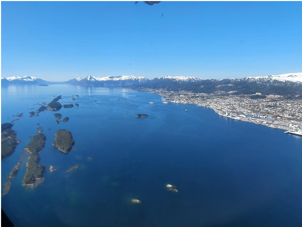
VNB inn for landing i Molde, og innlegg på Nyttårskonferansen i Møre og Romsdal 2022

Jeg er stolt både av det gode samarbeidet vi har med styret, våre medlemmer og av alt det Vest-Norges Brusselkontor (VNB) har levert i 2022.