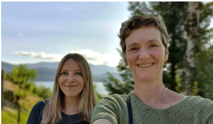
Teambuilding i Samnanger etter et halvt år med digitale møter

Det har vært viktig for kontoret å opprettholde god og jevnlig kontakt i en hverdag preget av hjemmekontor. De ansatte har hatt daglige oppdateringsmøter på Teams. Høstens arbeidssituasjon har vært svært annerledes, ettersom begge de to ansatte har hatt hovedbase i regionen, men med kortere opphold i Brussel for Europarådgiveren ved behov. Spesielt oktober og november ble viktige måneder for møter og interaksjon med medlemmene. Ikke minst betydde det felles kontorplass for de ansatte etter en lang periode med digitalt samarbeid fra hjemmekontor i to land.