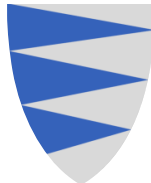
Sogn og Fjordane