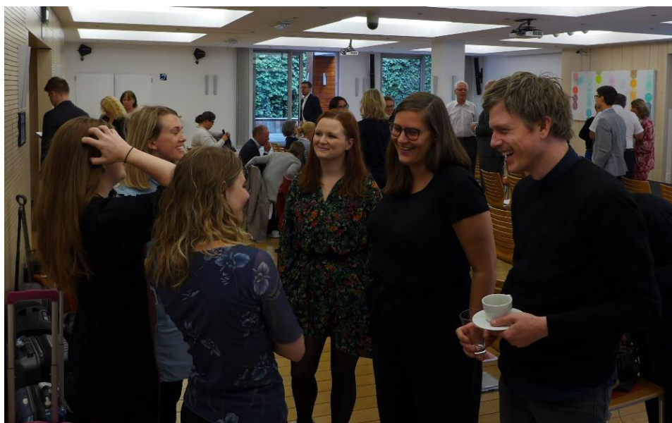
De norske regionkontorene samarbeider ofte. Her er et knippe rådgivere i samtale under Internasjonalt fylkesnettverk sin samling i Brussel.

Høsten 2018 tok VNB initiativ til en kartlegging av de andre regionens aktivitet og involvering i ERRIN, for å finne ut hvordan VNB bedre kan nytte medlemskapet og hvordan regionkontorene bedre kan samarbeide og dele informasjon om og fra ERRIN. Dette arbeidet jobbes det videre med i 2019.