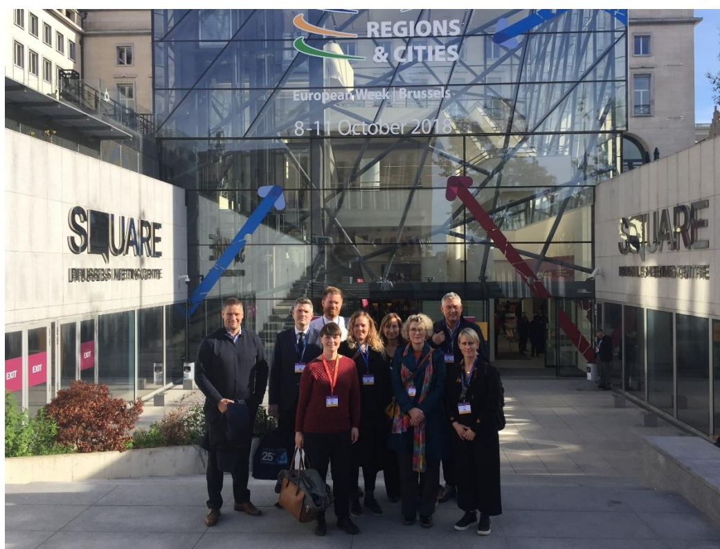
Deltagerne på EWRC fra Vest-Norge utenfor konferanselokalet the Square i Brussel.