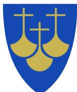
Møre og Romsdal