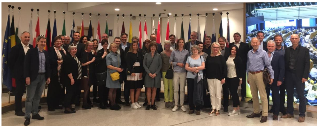
Opplæringsavdelingen i Hordaland på Besøk i Europaparlamentet.

Blant studiebesøkene i 2018 finner vi besøk fra Haram, med fire representanter fra Haram næring og innovasjonsforum, Haram kommune og nye Ålesund kommune. Haram skal sammen med fire andre kommuner utgjøre Ålesund kommune fra 2020. Programmet inkluderte møter med både VNB og andre aktører, hvor regional utvikling, maritim industri og kompetanse for fremtidens arbeidsmarked var tema. Turen dannet også et godt utgangspunkt for samtaler rundt samarbeidet mellom Haram, nye Ålesund og Vest-Norges Brusselkontor. De var også på en ekskursjon til Rotterdam for å se hvordan Rotterdam havn har omgjort en gammel havnebydel til et innovasjonssenter der yrkesutdanning og innovasjon går hånd i hånd.