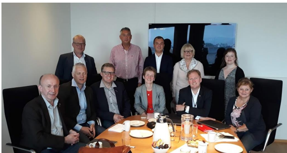
Representanter for medlemmene og VNB-administrasjonen på årsmøte og generalforsamling i juni.

Generalforsamlingen godkjente regnskapet for 2017 og årsberetningen 2017 for VNB AS i henhold til vedtektene. Styrevalg ble gjennomført og valgkomiteens forslag til styre i Vest-Norges Brusselkontor AS ble enstemmig vedtatt. Generalforsamlingen vedtok å foreslå en årlig indeksregulering av serviceavgiften til Foreningen VNB.