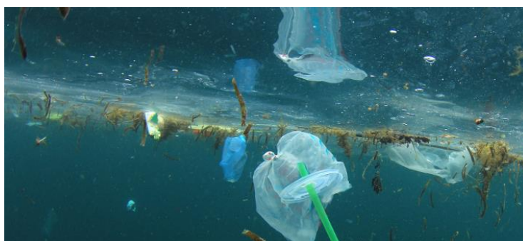
Marin forsøpling er på agendaen både i Norge og i EU.