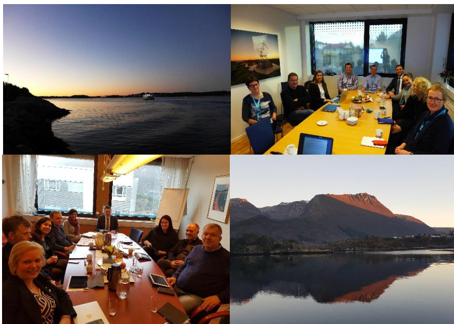
Glimt fra medlemsbesøk i Austevoll og Haram.

Vi ble blant annet invitert til å holde innlegg for fylkestinget i Sogn og Fjordane og vi møtte også gruppelederne i fylkestinget i Hordaland for å gi en orientering om vårt arbeid og viktige saker. Dette har vært viktige møteplasser med anledning til dialog med sentrale politikere i fylkene.