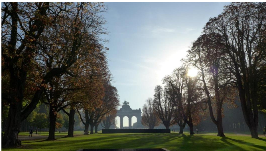
Parc du Cinquantenaire.

2017 har vist oss at store politiske endringer kan skje raskt og at internasjonale avtaler ikke nødvendigvis er fredet. Disse endringene kan vi også se konsekvensene av i regional sammenheng. Derfor er det viktig at vi er tilstede i Brussel for å være en del av det konstruktive samarbeidet som foregår der og også på den måten være med å sikre en god fremtid for Vestlandet.