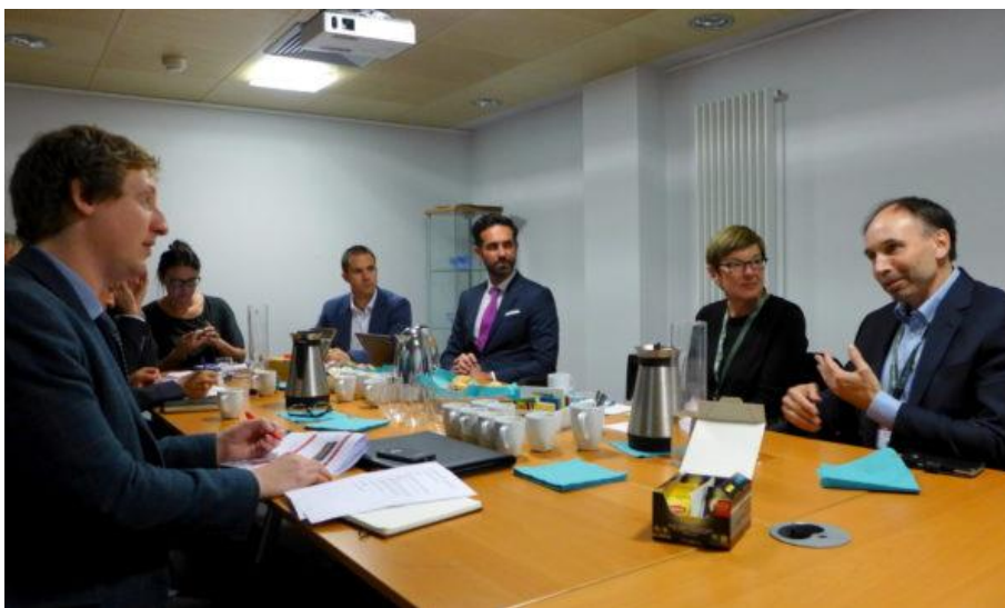
Fra Speaker's Breakfast før seminaret «Resilient Communities: Innovative data, energy and transport solutions».

Som en del av det regionale partnerskapet «Smart partnerships for resilient local communities» har VNB over flere år arrangert seminarer under EWRC for fulle hus. Partnerskapet besto i år av regionene Castilla y León og Asturias i Spania, Warmia-Mazury i Polen, Vila Nova de Famalicão i Portugal, Øst-England, Normandie i Frankrike, Västra Götaland i Sverige, Trøndelag og Vest-Norge.