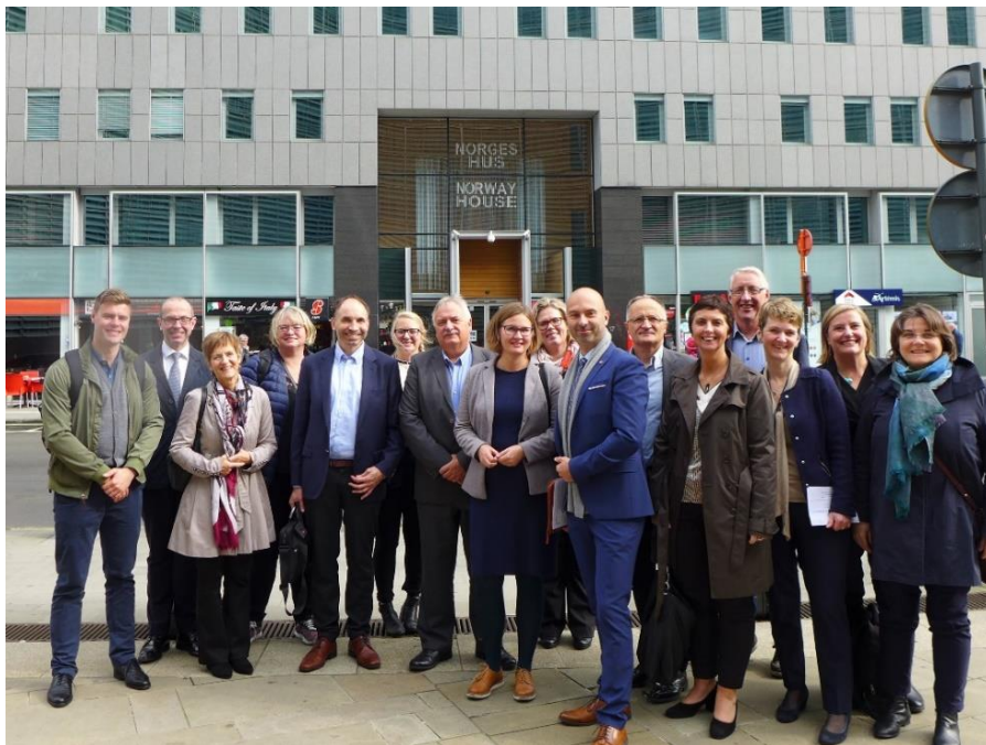
Deltakere fra Vest-Norge i Brussel under European Week of Regions and Cities.

samarbeid, nemlig EU som overnasjonalt samarbeid og EFTA som mellomstatlig samarbeid. Dette er noe som kan føre til utfordringer, men at aktørene som jobber i EFTA må sørge for at EØS-avtalen fungerer.