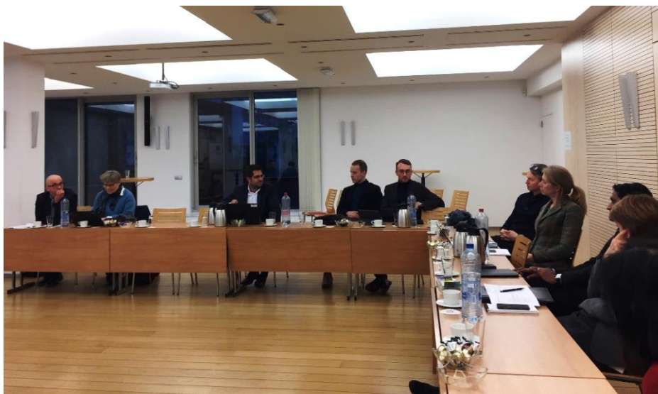
Norske aktører i Brussel samlet under forsknings- og innovasjonsmøte.

Det gode samarbeidet med Kunnskapskontoret har fortsatt i 2017, gjennom for eksempel foredrag hos hverandre for grupper eller møter om relevante tema og samarbeid om felles arrangement.