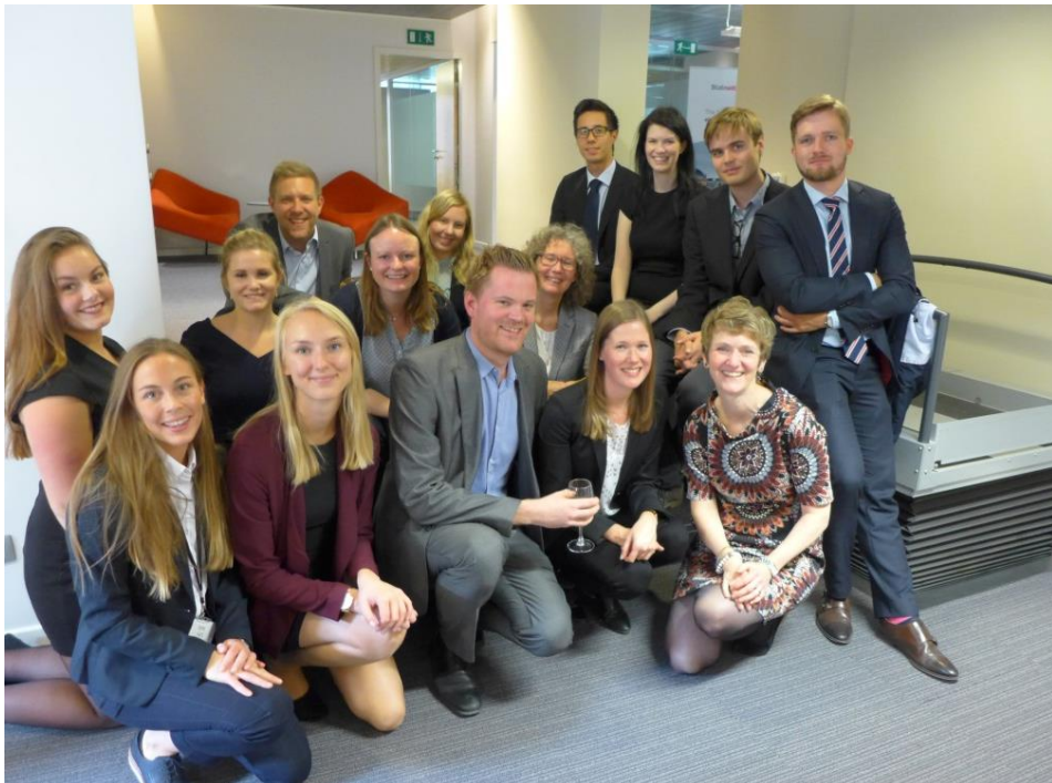
Gode kollegaer er viktig for et godt arbeidsmiljø. Her er vi sammen med kollegaer fra KS Brussel og de andre norske regionkontorene.

Virksomheten forsøker å redusere sitt miljøfotavtrykk blant annet ved å utføre møter via Skype/video og telefon i de tilfeller det blir funnet hensiktsmessig.